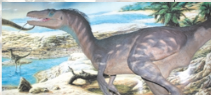
Uno dei modelli esposti nella mostra

La mostra è stata allestita dalla Cooperativa Darwin che dal 1993 si occupa di educazione ambientale. Oltre alle forme tradizionali di didattica, la Cooperativa progetta e realizza allestimenti museali, fornendo ad enti, musei, aree naturali protette, istituti scolastici, un supporto tecnico-scientifico originale per l'apprendimento delle Scienze Naturali.