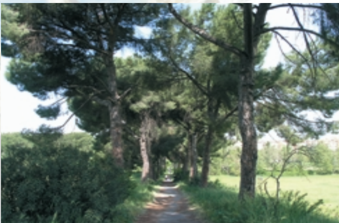
Parco Regionale Urbano di Aguzzano

RomaNatura gestisce il Sistema delle Aree Naturali Protette nel Comune di Roma promuovendone la fruizione da parte dei cittadini nel rispetto della natura: centri visita e sentier-natura, didattica ambientale, birdwatching , punti di ristoro, agriturismo e sport, agricoltura biologica e vendita di prodotti di qualità.