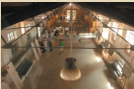
Interno del Centro di Cultura Ecologica

Il Centro ha come scopo la diffusione della cultura ecologica e dei temi della solidarietà tra i popoli. Particolare attenzione viene rivolta al mondo della scuola, nella convinzione che il rispetto e la tutela degli equilibri naturali sia anche e soprattutto una sfida di carattere culturale. In questo senso ha attivato una Biblioteca ad indirizzo scientifico ed un archivio storico del movimento ambientalista, aperti all'intera cittadinanza.