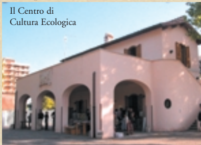
Il Centro di Cultura Ecologica

Il Centro di Cultura Ecologica nasce da un progetto LIPU-Casale Podere Rosa, reso possibile grazie al finanziamento del Comune di Roma - Assessorato alle Politiche Ambientali e Agricole e Assessorato alle Politiche per le Periferie, per lo Sviluppo Locale ed il Lavoro. Fa parte di una rete di 20 centri culturali che l'Assessorato alle Periferie sta realizzando nella periferia romana.