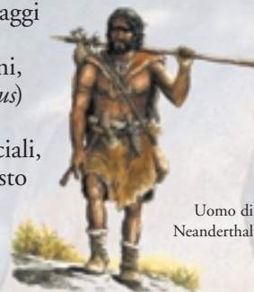
Uomo di Neanderthal

Successivamente, attraversando le vicissitudini climatiche che hanno caratterizzato il Pleistocene negli ultimi due milioni di anni, si incontrano paesaggi tropicali caratterizzati da bacini palustri e frequentati da ippopotami, dall'elefante antico ( Elephas antiquus ) e da una ricca avifauna acquatica. Con il susseguirsi delle epoche glaciali, gli ambienti forestali lasciano il posto a tipici ambienti di climi freddi, popolati da orsi e Mammuthus primigenius . Circa 130.000 anni fa compaiono nel nostro territorio i primi uomini neanderthaliani.