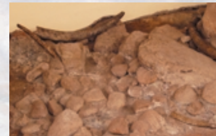
Interno del Museo Civico di Casal de' Pazzi

Il giacimento di Rebibbia-Casal de' Pazzi costituisce, al momento, l'unico deposito di età paleolitica scavato sistematicamente nell'area urbana di Roma, ed è inoltre l'ultima testimonianza della ricca serie di depositi che costellavano la valle dell'Aniene e che sono stati purtroppo distrutti dall'avanzare della città, per questo si è provveduto alla sua conservazione attraverso la realizzazione del Museo Civico di Casal de' Pazzi.